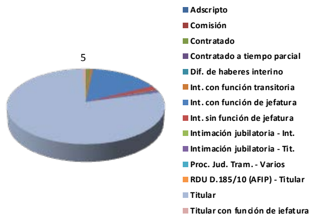
Situación de revista